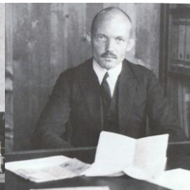
Claude Dornier 1914