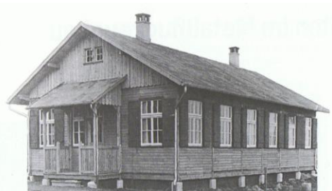
Die Baracke in Seemoos